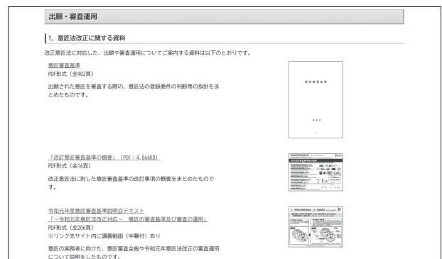
各種説明資料の紹介

また、意匠登録出願を検討中の方へ向けて、事前調査に有効なツールを紹介しています。