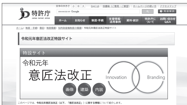
サイトのトップページ